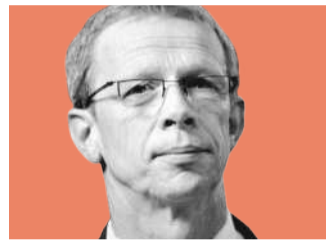
Klaus Mohrs, Wolfsburger OB, sieht bei den Bürgern ein »Anspruchsdenken«